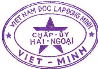
(in purple and red)

Viet Nam Independence League Overseas member of executive committee Viet-Minh